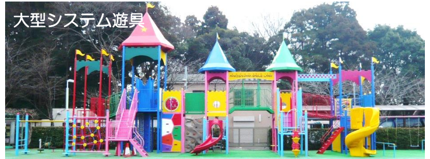
大型システム遊具